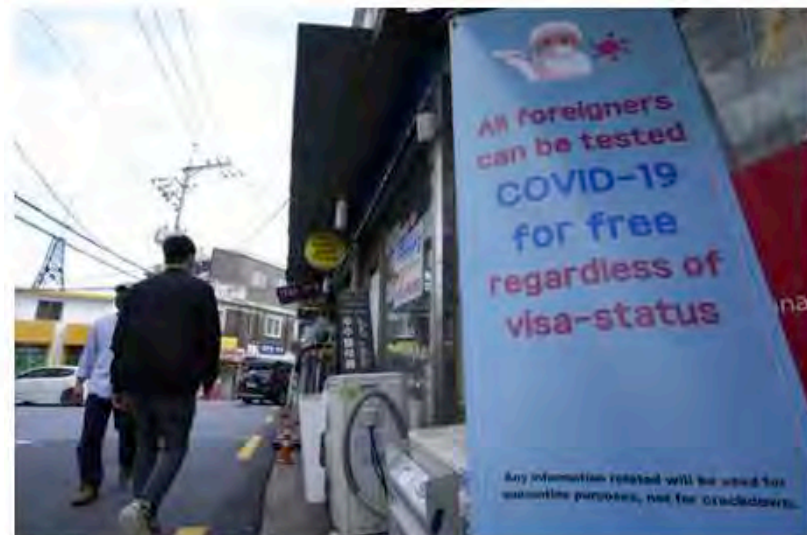
韓國新冠肺炎疫情 | 圖為2021年10月16日，首爾梨泰院的途人行經一處提供病毒檢測服務的告示。梨泰院是有名的商業區、旅遊區，也是有大量外國人居住的地方。

美國總統拜登 (Joe Biden) 5日稱，華府已預訂數以百萬計的Paxlovid，「如獲得食品和藥物管理局 (FDA) 授權，我們可能很快就有藥物，能治療受 (新冠) 病毒感染的那些人，」他稱：「(口服藥) 治療是我們工具箱中的另一個工具，保護人們免受感染新冠的最壞後果 (影響)。」