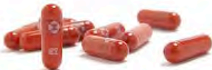
圖為2021年10月1日，美國默沙東藥廠研發的新型冠狀病毒肺炎口服藥Molnupiravir。(AP)

美國總統拜登 (Joe Biden) 5日稱，華府已預訂數以百萬計的Paxlovid，「如獲得食品和藥物管理局 (FDA) 授權，我們可能很快就有藥物，能治療受 (新冠) 病毒感染的那些人，」他稱：「(口服藥) 治療是我們工具箱中的另一個工具，保護人們免受感染新冠的最壞後果 (影響)。」